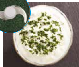
ÖRTER / PERSILJA